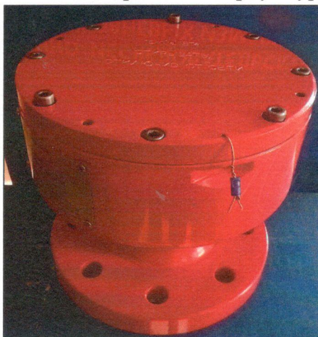
Рисунок 2 – Место пломбировки уровнемеров многофазных УМФ700

На рисунке 2 указано место пломбировки на корпусе уровнемеров.